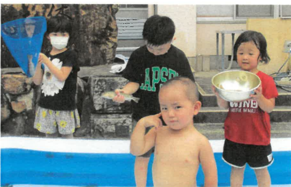
つかみ取りに夢中になるうちに、素っ裸になる子もいました。