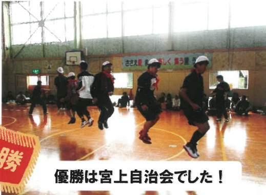
優勝は宮上自治会でした！

安来消防署の方にも来ていただき、救急蘇生方や消火器の訓練など指導していただきました。毎年行われている訓練ですが、“継続は力なり”とっさのときに役に立つよう、今後も訓練しておきたいものですね。