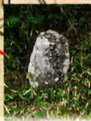
清水分かれの道標