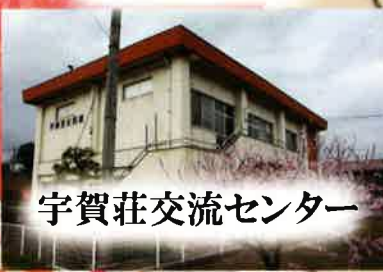
宇賀荘交流センター