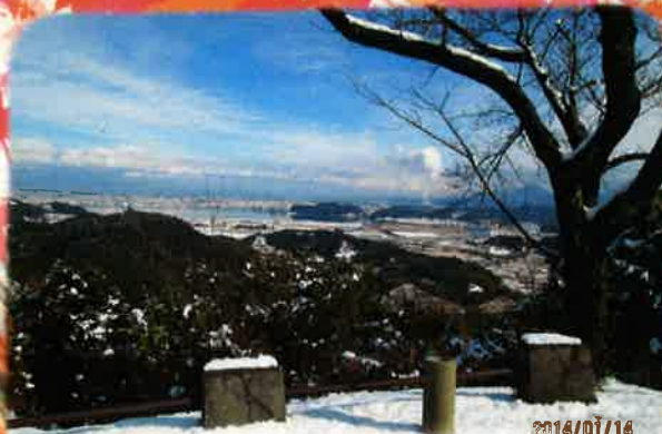
清水展望台からの冬景色 =米子方面の眺望=