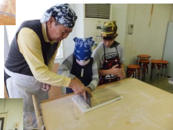
12月8日(土) そば打ち会