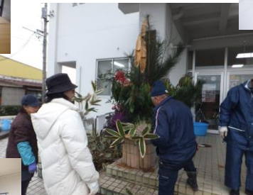
12月26日(水) 門松作り《寿会》