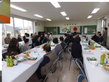
1月6日(日) 新年祝賀会