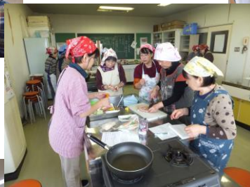
12月4日(火) おもてなし料理教室