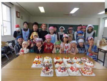
12月23日(日) クリスマスケーキ作り