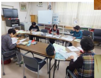
11月13日(火) ちぎり絵講習会