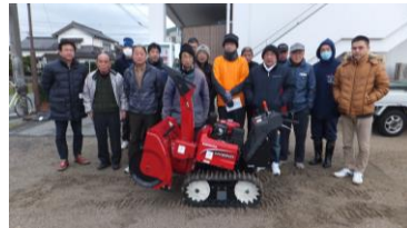
2/10 除雪機操作講習会をおこないました