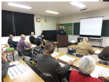
1月24日(木) あいサポート講習会