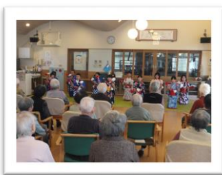
手作り銭太鼓を使って芸能発表