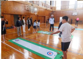
10月20日(土) ニュースポーツ大会