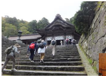
10月13日(土) 秋の大塚健康ウォーク 《大山》