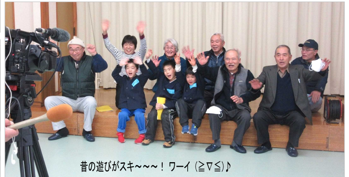
昔の遊びがスキ〜!! ワーイ (≧▽≦)♪