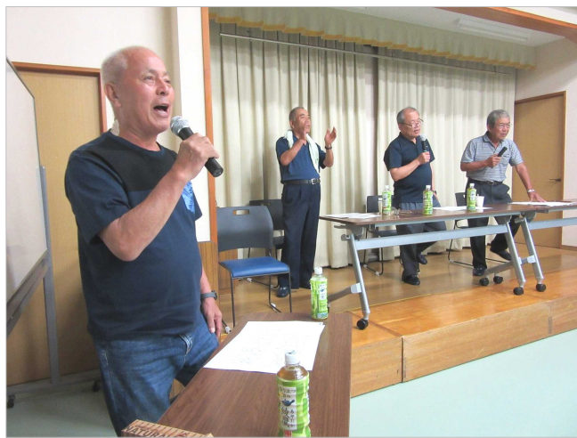
やっぱりナマ唄は迫力満点です！

5年ぶりの盆踊りに向けて、8月1日と8日に開催した「くどきと踊りの練習会」。久しぶりの練習会に、最初は戸惑い気味でしたが、すぐにカンを取り戻すところは、さすが地元の皆さんです！皆さん良い汗をかいておられました(*^_^*)。15日開催予定だった「奥田原地区盆踊り大会」は、残念ながら台風7号接近のため中止となりましたが、今回取り戻したくどきと踊りのカンは、もう1年間身体の中で温めて来年の盆踊り大会で発揮しましょう！(≥▽≤)♪