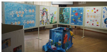
(昨年度の展示の様子)