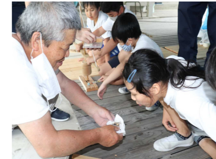
(火起こし体験の様子)