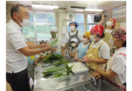
(笹巻き作りの様子)