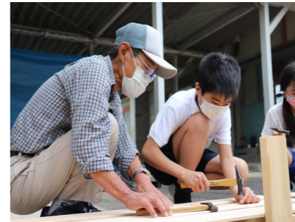
(うさぎ小屋フェンス作りの様子)

井尻小学校では学習の一環でクラブ活動が年5回あります。3～6年生が、物作り・運動・料理の3つのクラブに分かれ、地域の方が講師となり児童と活動します。5月に顔合わせがあり、6月12日のクラブ活動では、物作りクラブはうさぎ小屋のフェンス作り、運動クラブは火起こし体験、料理クラブは笹巻き作りをしました。