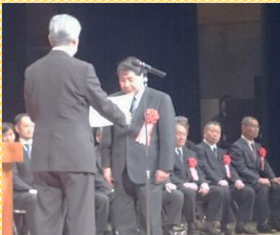
島根県公民館研究集会での表彰の様子。 安来市広瀬交流センターと奥出雲町立阿井公 民館の2館が表彰を受けました。