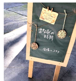
会場づくりにも工夫を