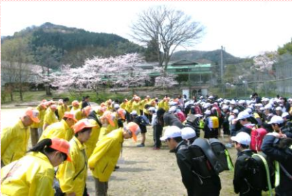
昨年の対面式の様子