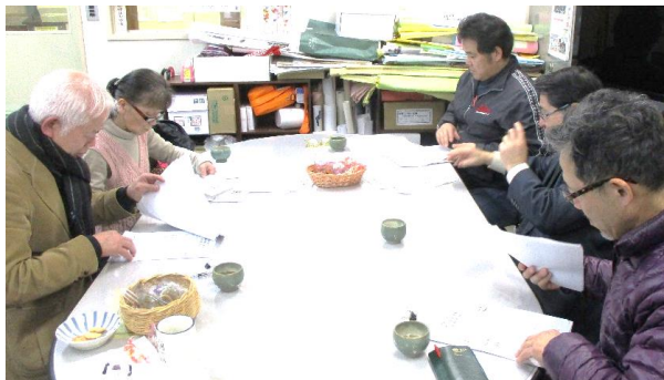
「どの名前もいいなあ」と悩む選考委員さん