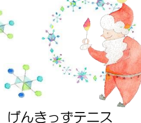
げんきっすテニス