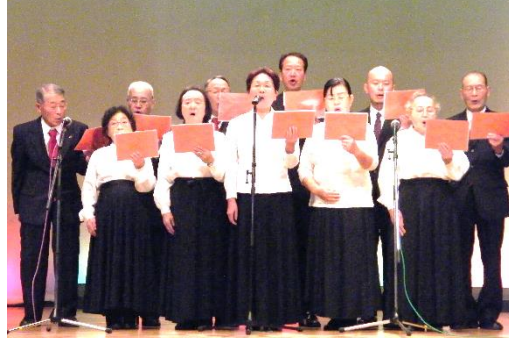
*清吟堂吟友会安来ブロック 富田川支部・幸盛支部 (詩吟)