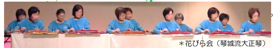
*花びら会 (琴城流大正琴)