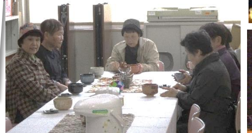
*喫茶コーナー・抹茶席