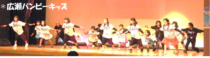
*広瀬バンビーキッズ