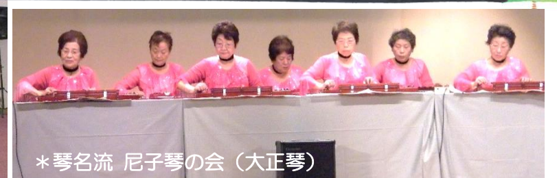
*琴名流 尼子琴の会 (大正琴)