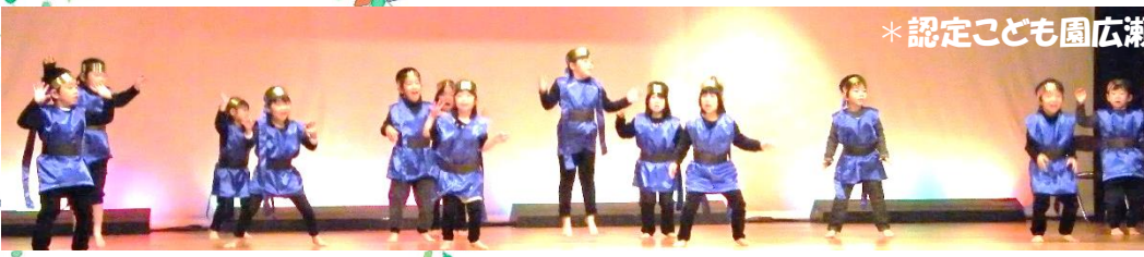
*認定こども園広瀬