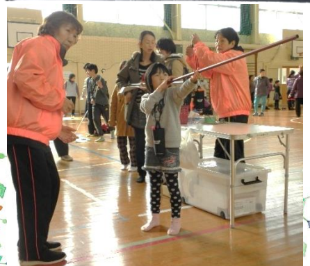
★体づくりコーナー★