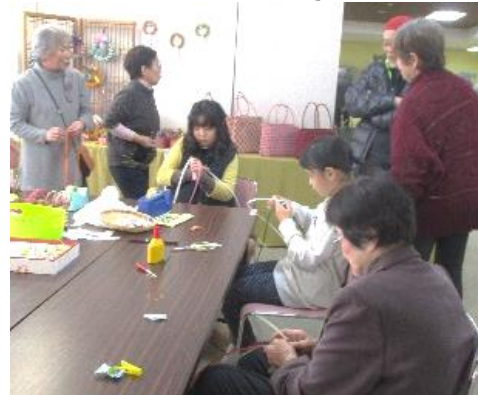
*手作りおもちゃの会