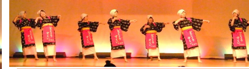
*尼子舞まいクラブ