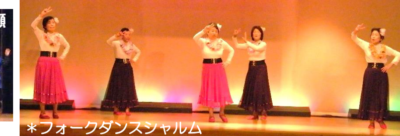
*フォークダンスシャルム