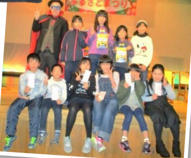
優勝 Uチーム アイラスユー