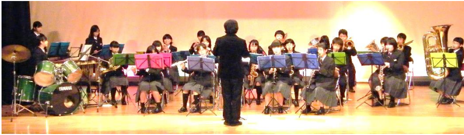
*広瀬中学校吹奏楽部