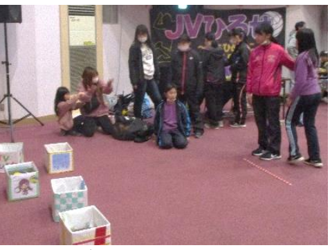
JVひろせ 広瀬バンビーキッズ