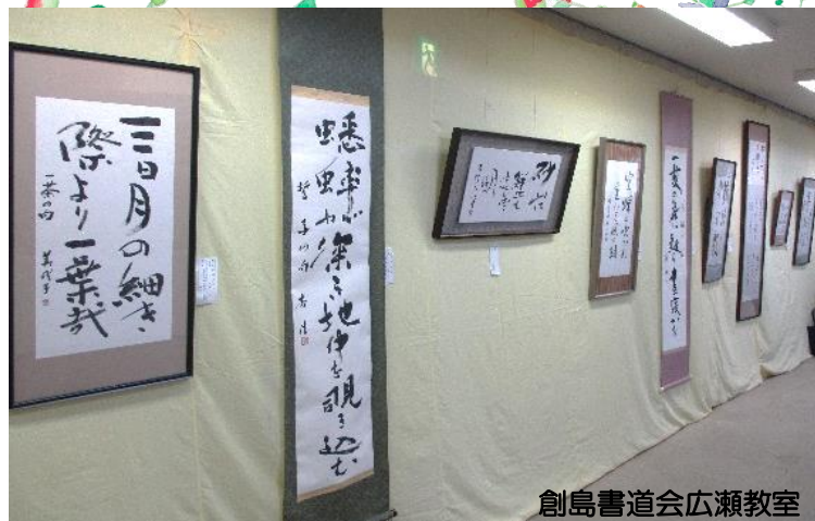
創島書道会広瀬教室