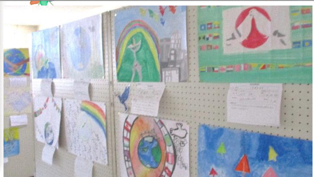
出雲広瀬ライオンズクラブ「平和ポスター」