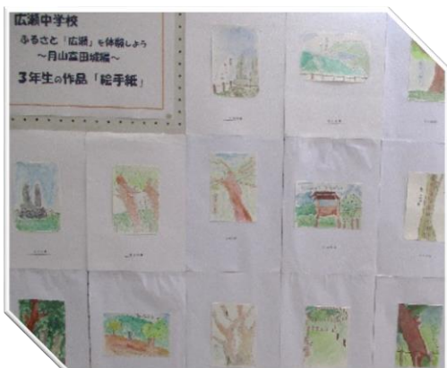
広瀬中学校3年「絵手紙」