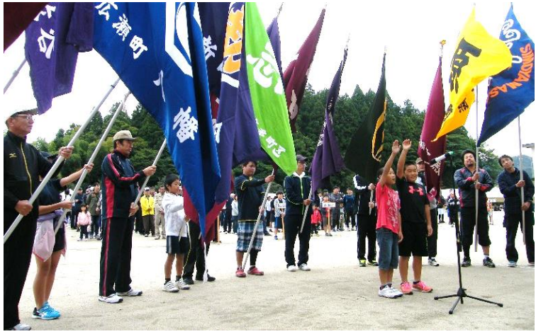
※別紙「特別増刊号 特集・町民体育大会」に大会の様子を載せています

競技を通じ、地域のみなさんが声をかけあい、力を合わせることで、地域の絆がより強く感じられる大会となりました。