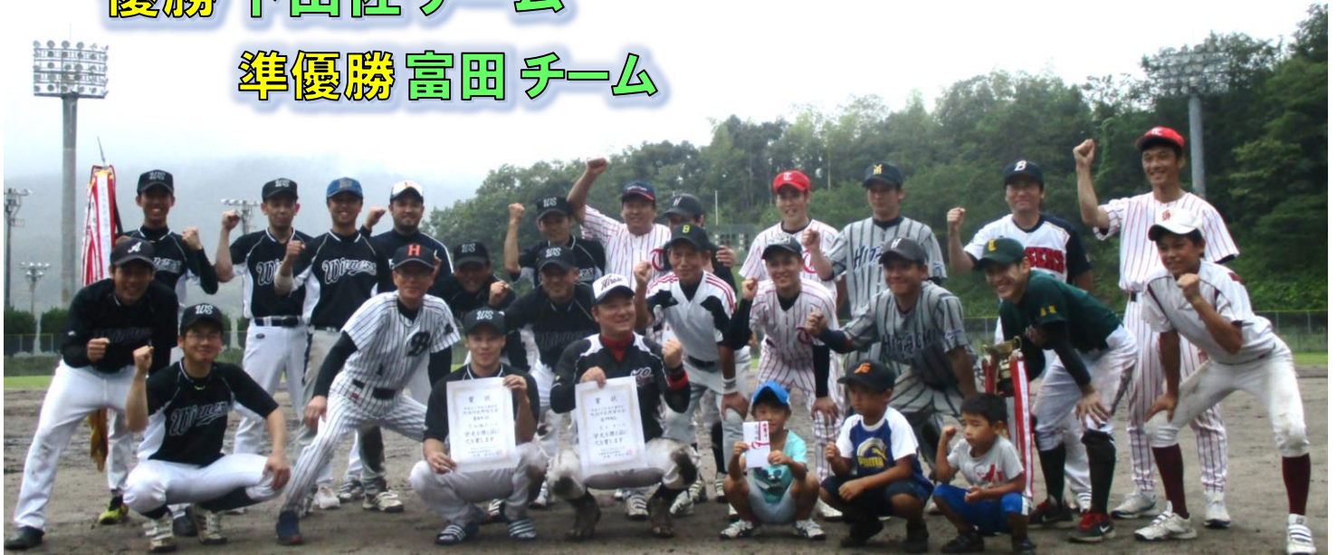
下山佐チームと富田チーム、決勝戦後は笑顔で仲良く記念写真