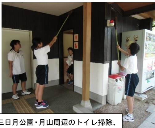
三日月公園・月山周辺のトイレ掃除、ゴミ拾い、草取りをおこないました。

地域とかかわりある生徒会活動を目指し、自分達ができることを考え行動する中学生の姿は頼もしく見えました。