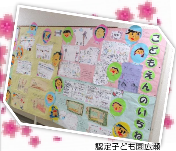
認定子ども園広瀬