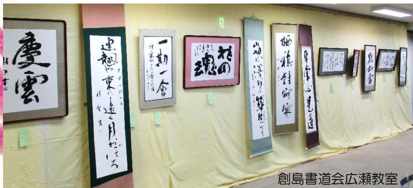
創島書道会広瀬教室