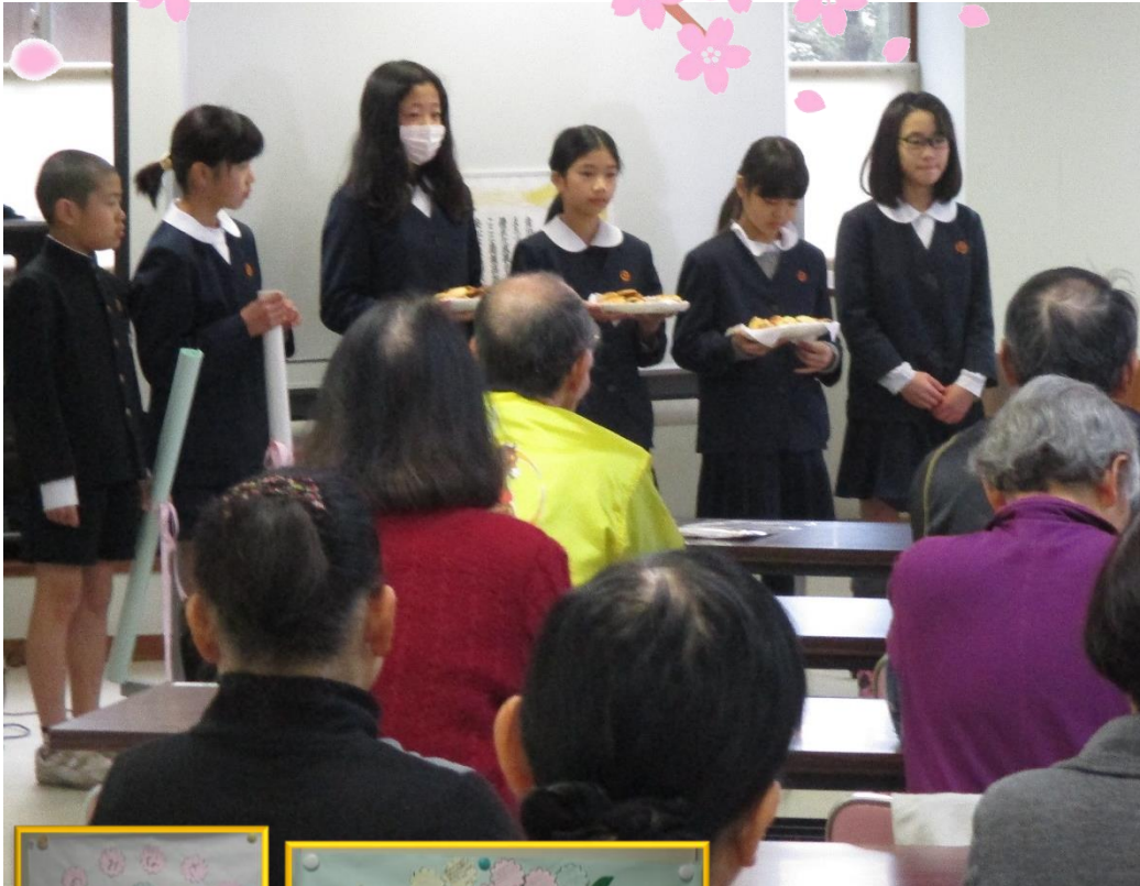
※子ども達からのメッセージは3月15日〜3月31日まで 広瀬交流センターに掲示しています