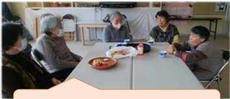
体操の後のお茶会の様子