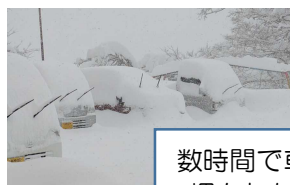
数時間で車が雪に埋もれた日も。

3月に向けて、日中は暖くなる日もありますが朝晩は急に冷え込むこともあるので、寒暖差による体調不良に気をつけてください。