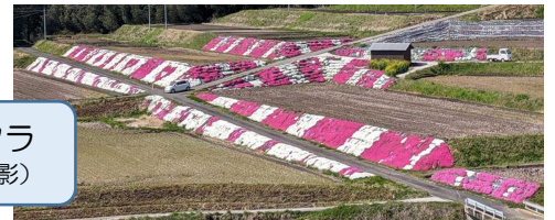
松本地区のシバザクラ (4/14・田中地区より撮影)

近くの湯田山荘もりリニューアルオープンしたので、この春は素敵なシバザクラをみて、比田温泉も楽しんでいただくと良いかと思えます。