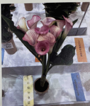
※最優秀賞のカラー

7月30日『しまね夏の花品評会』にて、6点の入賞のうち、比田から最優秀賞を含め3点が受賞をするという快挙を達成されました。おめでとうございます(^o^)