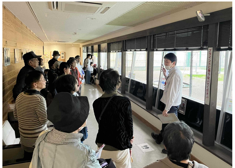
「トキを見に行こう！」の様子

30日(月)、年度末となりましたが、この事業を企画して3年目となる「島根魅力発見お出かけレク」を開催し、24名の皆さんに参加してもらうことができました。出雲のトキの人工飼育に取り組んでいる所に加え、私の勤務したこともある出雲農林高校の農場見学を行いました。「トキ飼育センター」では、トキの姿(この時期一般公開されているのは雄のみ)を職員の方に詳しく説明していただきました。来年度でしたか、地元でも放鳥されるようです。また、秋には、雌雄のトキも見られるようです。出雲農林では、学校の好意で皆さんにヨーグルトの試食をしてもらいま