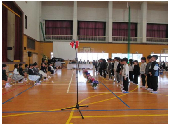
「赤江小学校入学式」の様子

そして、9日(木)、午前中は赤江小学校、午後は安来三中の入学式に参列させていただきました。赤江小学校の入学式では、新入生が19名とお聞きし、大変びっくりしました。赤江小学校は、市内でも十神小学校に次いで多くの児童がいる学校だと聞いています。勝手な考えかもしれませんが、ちょうど流行性コロナとの関係もあるのかとも思いました。そうでした今年、中学校に入学する生徒も1年生の時にコロナの影響で入学式が延びたように思います。この世代の子どもたちにとって将来どのような影響があるのか考えさせられました。それにしても、赤江小学校に入学した子どもたち、かわいさいっぱいでした。