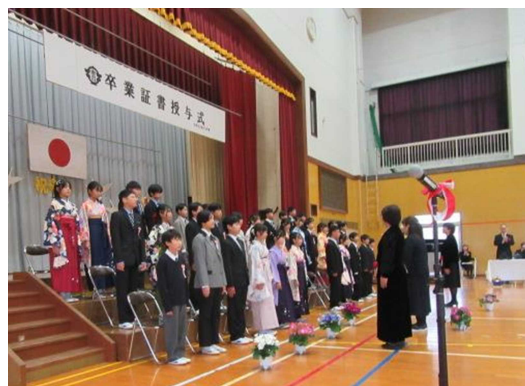
「赤江小学校卒業式」の様子

少し長くなりました。積み残しの3月の事業からお伝えします。3月は、松江農林、安来三中、そして赤江小学校の卒業式に参列しました。それぞれ特色があるように感じていますが、ひとつ今年、農林の答辞で、お母さんに育ててもらった感謝の言葉を涙ながら伝えてくれた男子生徒の感謝の言葉が心に残りました。それぞれ卒業式というものは、本当に人生のひとつの節目となるものと思えました。赤江小学校の卒業式、多くの女児の皆さんは「はかま姿」、最近の流行のようです。毎年、参列して写真を撮ってますが、カメラのバッテリーが無くなっている状態、辛うじて1枚写せました。