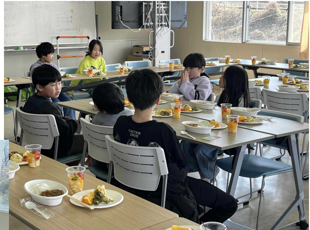
「あかえふれあい食堂」の様子