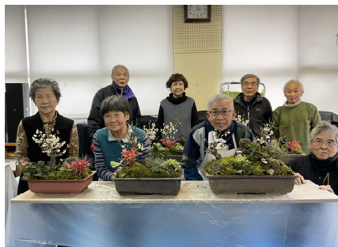
「正月の寄せ植え教室」の様子