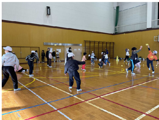
「めだかクラブ 運動会」の様子

19日(金)、めだかクラブの『めだかクラブ運動会』を赤江小学校の体育館で行いました。主事ふたりが色々と考えてくれた競技で行いました。なかなか思うように子どもたちも動いてくれない場面もありましたが、当の子どもたちは、一生懸命に取り組んでくれました。本当に皆、どうも走り回ることが好きなようで、私など高齢者には考えられないことでした。情報科学高校の生徒2名がボランティアで協力してくれました。