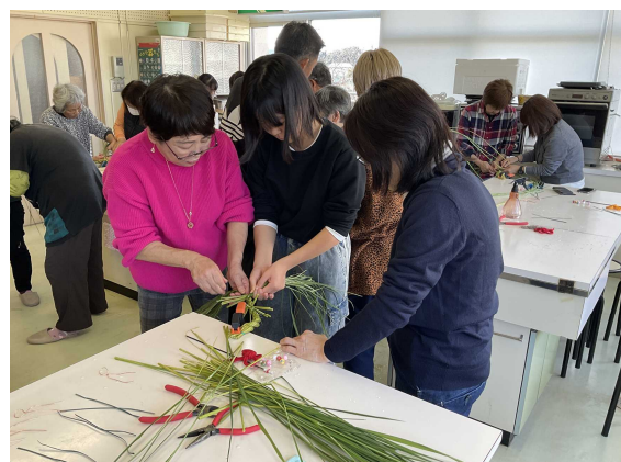
「しめ飾りワークショップ」の様子

そして、午後は、この赤江地区にUIターンでお越しの方と地元の方との交流の場として行っている事業として、今年もしめ縄づくり体験をしてみたいという意見から行いました。残念ながらUIターンの皆さんは、それほど多くの方の参加がなかったのは寂しく思いましたが、16名参加され、皆さん講師としてお願いした方の楽しいトークのもと、従来のしめ縄とはちょっと違った作品づくりを体験してもらいました。