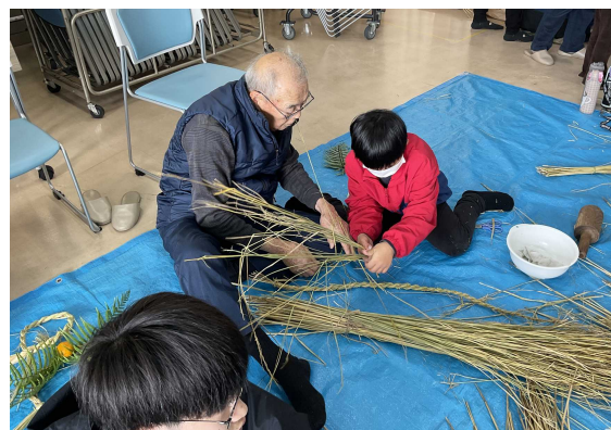
「しめ縄づくり」の様子

翌日20日(土)、午前中は、例年どおりの赤江地区青少年健全育成協議会主催の『しめ縄づくり』を行いました。使用した藁は、もちろんめだかクラブで栽培したいたもち米の藁を利用しました。作り方は寿朗会の方と技術をお持ちの方をお願いしました。2組の親子やあかえっ子クラブの子どもたちに参加してもらいました。赤江地区担当の安来警察署の警察官の方も参加してもらいました。その方は、田植えや稲刈りも一緒に協力してもらいました。農業地区の赤江でもありますから、もっと地区の皆さんにも参加してもらいたいものだと思います。