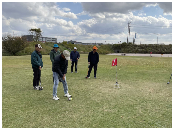
「グラウンドゴルフ大会」の様子

21日(金)、『グラウンドゴルフ大会』を、飯島の伯太川沿いにある会場で行いました。当日は、ちょっと寒い天候でしたが、参加された皆さん和気あいあいと、楽しんでもらったように思います。昨年の反省で、ホールインワンの商品を増やしました。