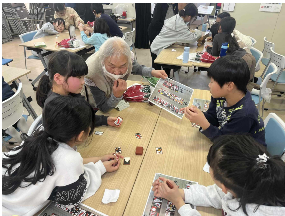
「子どもわくわく」の様子

25日(木)、前半は、昨年から有志の皆さんで取り組まれている『子ども食堂』(ふれあい食堂)と共催する形で、昼食後、教員OBの皆さんを中心に開催している『子どもわくわく隊』の活動として、ボードゲームを体験してもらいました。昔なら正月家族で楽しんだトランプ遊び、将棋、そして花札などを、私も子どもたちと一緒に楽しむことができました。花札の絵柄など季節に伴うことなど話しながら私も久々に昔のことを思いながら楽しむことができました。