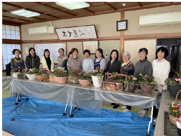
「秋の寄せ植え教室」の様子

11月7日(金)、『秋の寄せ植え教室』を日ごろボランティアとしてご協力いただいている方を対象に、恥ずかしながら私が講師として行いました。こうした才能は全くないのですが、それでも皆さんに喜んでもらえるように必要な苗を選んで準備し、植え付けをしてもらい、赤江文化祭では、その作品を展示してもらいました。