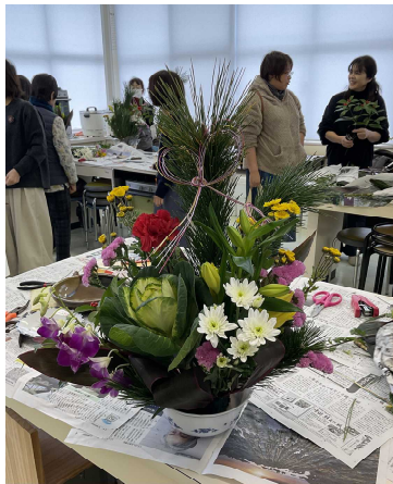
「正月のフラワーアレンジメント」の様子

26日(金)、恒例の『正月のフラワーアレンジメント』とそれに対して男性の方を対象とした『正月の寄せ植え教室』を開催しました。『寄せ植えづくり』に参加された女性の方が「私も体験したかった」とのこと。性別で判断してきたことに反省です。ちょっとだけ苦労しているのが、梅の苗を正月に向けて開花させることです。我が家の温床を使って調整しているのですが、植え付ける何日か前に20℃近くの日があり、開花し、寄せ植え当日には六部咲きとなっていました。難しいものです。でも皆さん素晴らしい正月向け寄せ植えができ、きっと玄関あたりに飾ってもらえたと思っています。