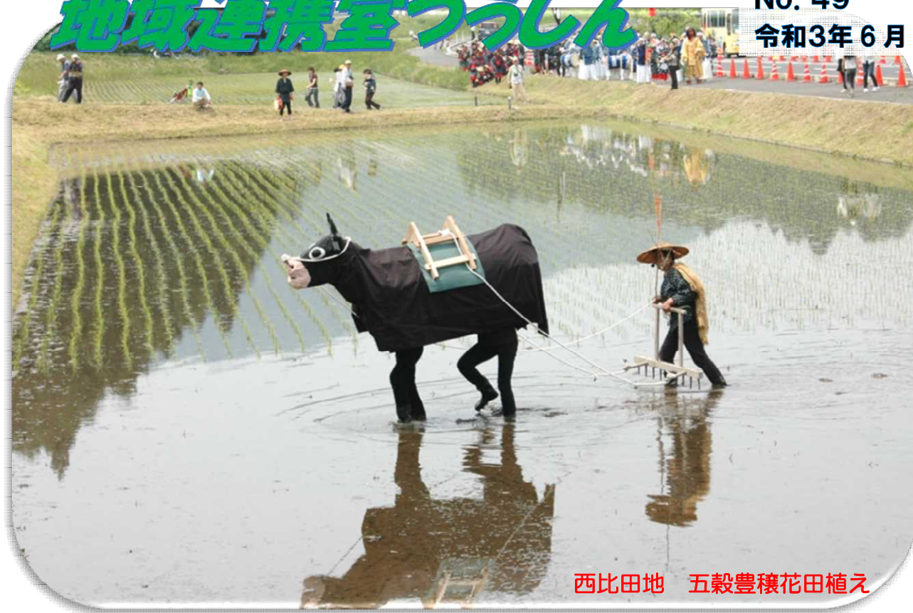
西比田地 五穀豊穰花田植え