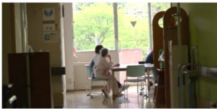
患者様に寄り添う