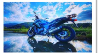
ワークライフ・バランス

「日々患者様と関わり学ぶことも多い中で、先輩看護師や周りの方々に支えてもらい業務に励むことができます。患者様からの「ありがとう。」を大切に、沢山の人の力になれるよう、これからも楽しく看護して行きたいと思います。」