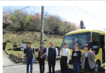
地域を知る・めぐる