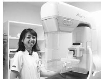
マンモグラフィ装置