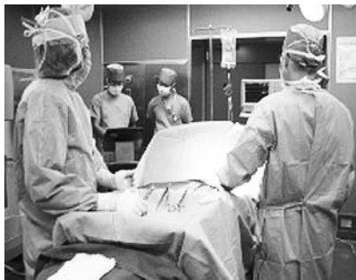
ペースメーカー業務

私たち臨床工学技士は医療機器を通じて、患者さまに安心・安全な治療を提供できるように日々精進して参りますので、今後ともよろしくお願いたします。