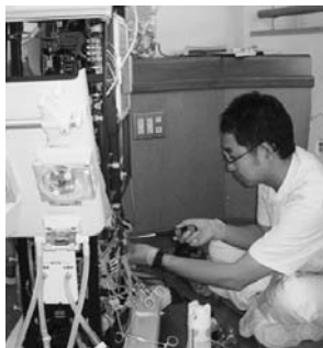
透析装置点検・部品交換

当院には3名の臨床工学技士が所属しています。主な業務としては血液浄化業務（人工透析）、医療機器管理業務、ペースメーカー業務があります。当院の詳しい業務内容については安来市立病院ホームページ、部門紹介＞医療技術部＞臨床工学室のページをご覧ください。