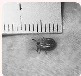
図・皮膚に吸着しているフタトゲチマダニ

主な症状：発熱（高熱）、頭痛・関節痛、体や手足の発疹 発症までの期間：感染してから（マダニに咬まれてから）2～10日