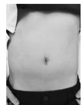
へそだけの傷あと