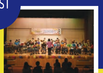
●広瀬中学校吹奏楽部