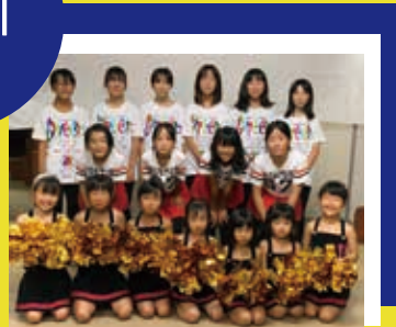
●広瀬バンビーキッズダンスステージ