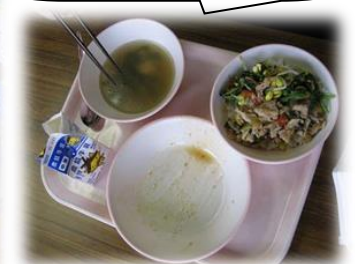
メニューはブルコギ丼