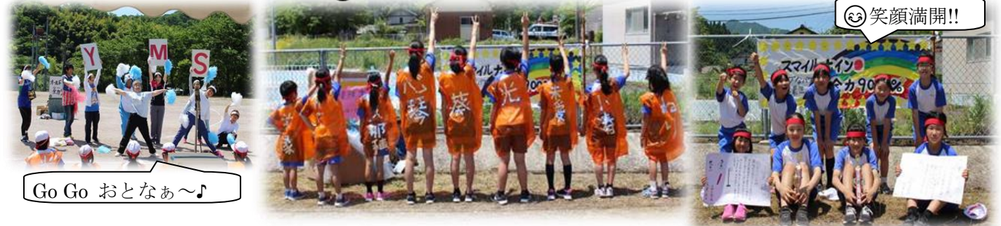
Go Go おとなあ〜♪