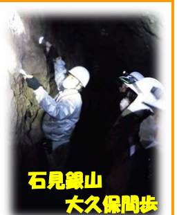
石見銀山 大久保間歩

どの場所でも、堂々と自分の思いを言葉にし、お世話になった方に感想を伝える子ども達の姿はとても素敵でした。また、3校お互いのいい姿に影響を受けながら過ごす様子が見られ、連合チームならではの良さを感じることができる2日間でした。 ④