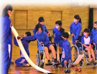
車イスやランプを使って