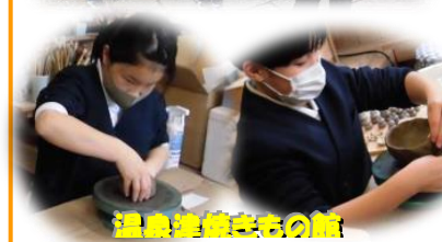
温泉津焼きもの館