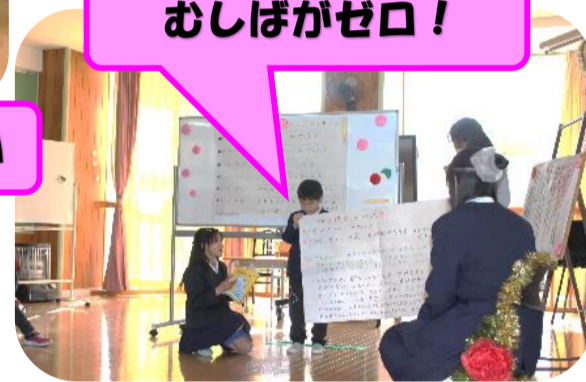
〇〇ちゃんのえがおがまぶしい