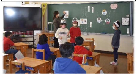
2年 道徳 公正・公平