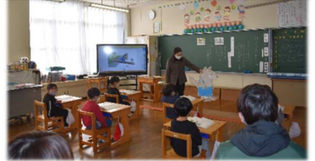
1年 道徳 親切・思いやり