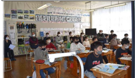
5・6年 社会 竹島問題