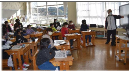
3・4年 道徳 いじめって？