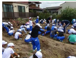
1年生はサツマイモの収穫をしました。今年も豊作。あちこちらで歓声が上がっていました。