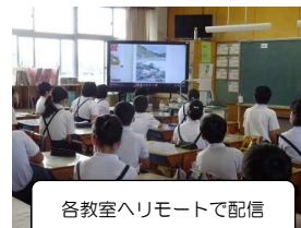
各教室へリモートで配信