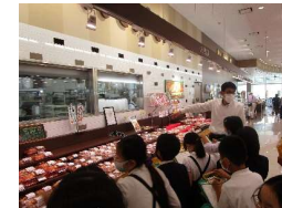
3年生は、社会科で「まるごと」の見学に行きました。お店の工夫をたくさん見つけました。