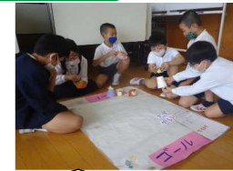
2年生は、生活科で「おもちゃづくり」をしました。グループで工夫しながら楽しみました。