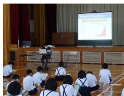
4年生は環境学習で、市役所の方から「Cool Choice(賢い選択)」について学びました。