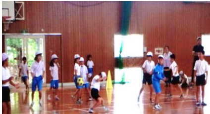
3年 学活 「ドッチボールを楽しもう」

33名の1年生を迎えて始まった1学期。新型コロナウイルス感染症は5類移行となりましたが、引き続き感染対策をとりながら、子ども達の学びを保障する日々を過ごすことができました。