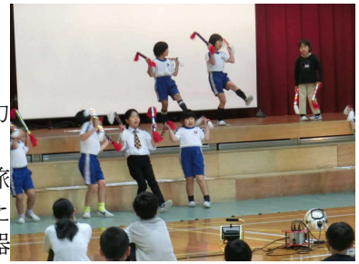
2年「はっけんはっけん大はっけん」

学習発表会の前に本校ではインフルエンザの流行があり、計画通りに準備や練習ができず、苦心をしての本番でした。当日、どの発表もみんなの心が一つになってがんばっているのが感じられてとてもうれしい気持ちになりました。クラスの団結がいつそう深まったと思います。充実した学習発表会になりました。