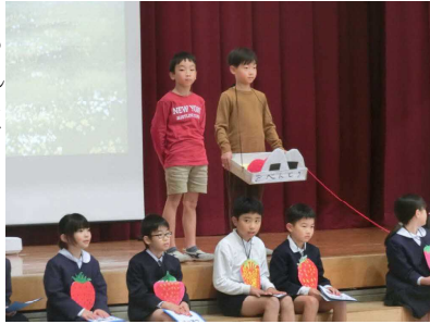
3年「いちごころりん」 ～ こちらのきっこいちご研究所 ～