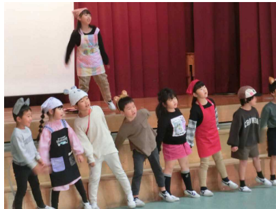
1年「サラダでげんき」