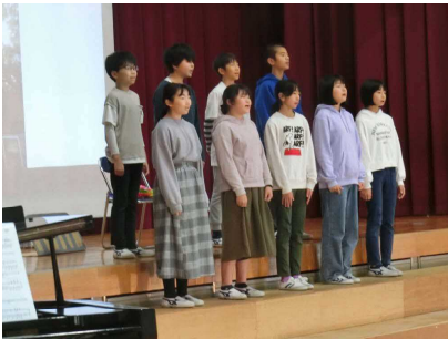
6年「サダコストーリー」 ～今わたしたちができること～