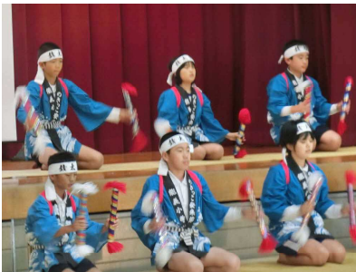
4, 5年「安来節」 銭太鼓・どじょうすくい