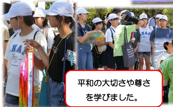
平和の大切さや尊さを学びました。