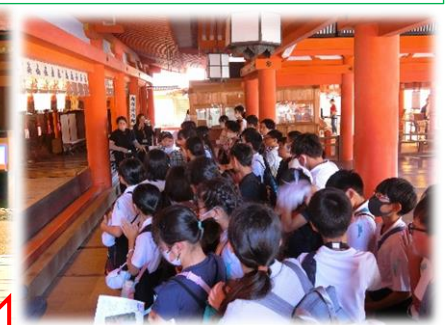
本殿をバックにハイピース!