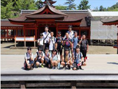
【厳島神社・赤屋小6年生と】

9月7日(木)・8日(金)には、伯太町4小学校の6年生が合同で修学旅行に出かけてきました。井尻小学校の6年生3名も全員元気に参加しました。ここ数年コロナの影響で県内旅行でしたが、数年ぶりの広島方面への旅行となりました。宮島、平和記念公園、大和ミュージアム、みろくの里が主な訪問先で、平和学習を中心に充実した学習が行えたようです。班長などそれぞれの役割をしっかりと果たし、友だちとの楽しい思い出をたくさん作って帰ってきました。