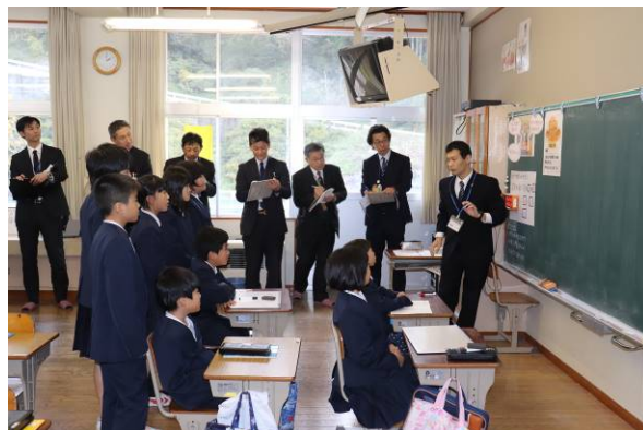
学習の導入（2学年一緒に）