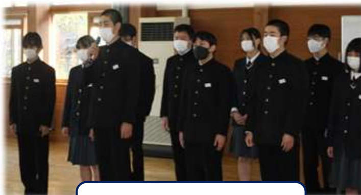
生徒会本部役員、執行部員一人一人が抱負を述べました。