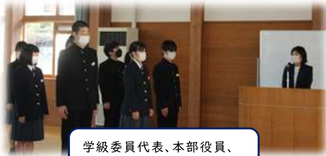
学級委員代表、本部役員、議長・副議長は校長が任命

1月12日には、3学期学級委員、生徒会本部役員、議長・副議長、執行部員の任命式を行いました。リモートではありましたが、全校生徒が注目する中で任命書を受け取る姿からは緊張感が伝わってきました。