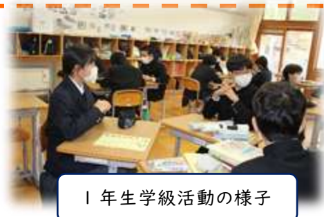
1年生学級活動の様子

また、「できていること」「できるようになったこと」をしっかりと伝え、新たなステップへの意欲を高めていきます。