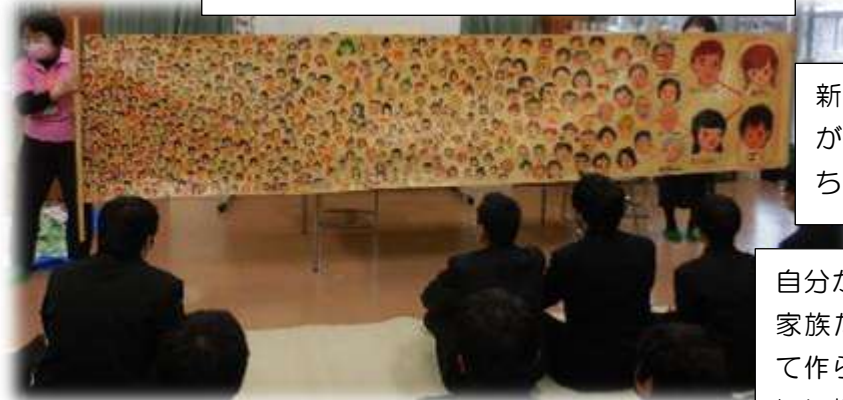
助産師からのメッセージ

命ができるところから生まれるまでにたくさん大変なことやうれしいことがあり、命の素晴らしさに改めて理解が深まりました。