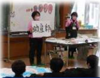
助産師の仕事について

島根県助産師会に所属する助産師2名を講師として、生の楽習出前講座(中学2年生対象)を実施しました。講座では、「助産師の仕事について、誕生日の意味、いのちのはじまり、思春期の変化と悩み、助産師からのメッセージ」など、体験も交えながらお話してもらいました。