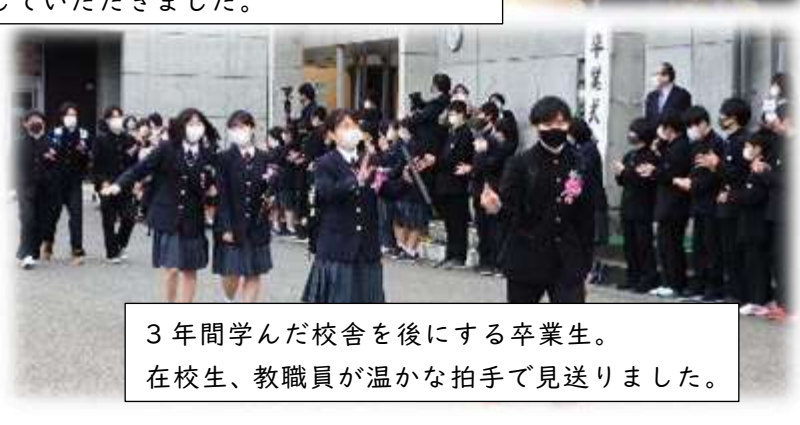
3年間学んだ校舎を後にする卒業生。 在校生、教職員が温かな拍手で見送りました。