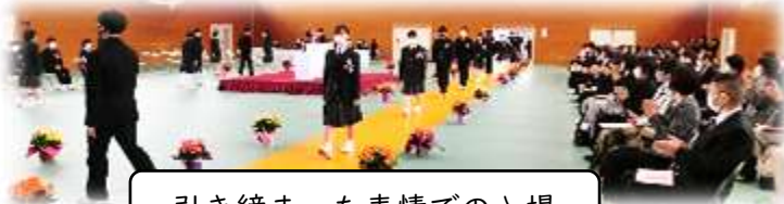
引き締まった表情での入場

入場から退場まで、広瀬中学校の卒業生として「最高のふるまい」を見せてくれた3年生を、春の日差しが照らしていました。