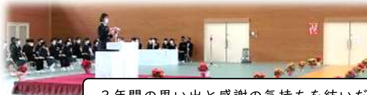
3年間の思い出と感謝の気持ちを紡いだ答辞