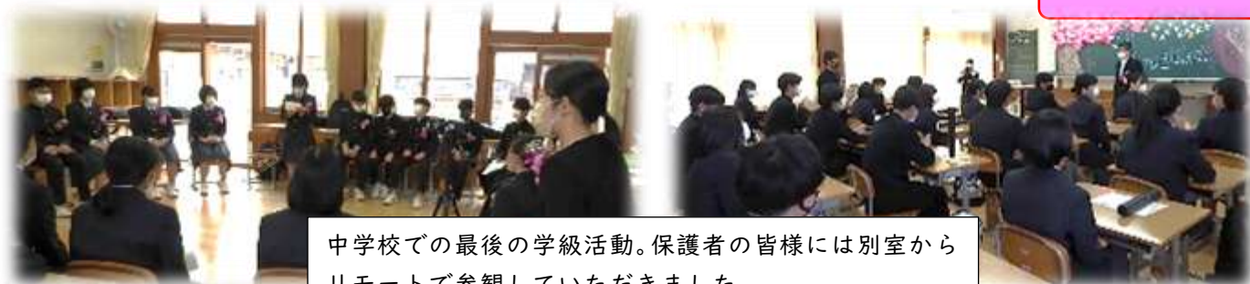
中学校での最後の学級活動。保護者の皆様には別室からリモートで参観していただきました。