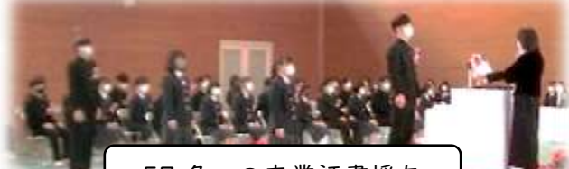
57名への卒業証書授与