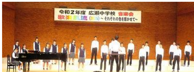
「旅立ちの時～Asian Dream Song～」 3年1組