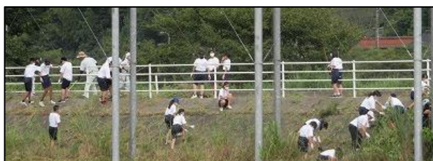
8月23日(日)PTA環境整備作業 きれいになった校舎で2学期も頑張ります！ありがとうございました。

2学期の学校経営では「安心安全」を第一に掲げました。安心して授業や行事に取り組んでいくことができるよう、危機管理には細心の注意を払いたしたいと思います。