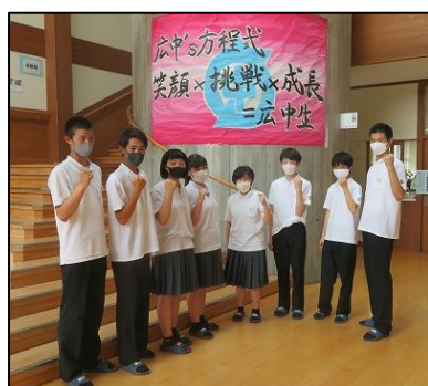
7月29日 壮行式のあと

ほとんどの3年生にとって、今年最初で最後の公式大会となった安来市総合体育大会（代替大会）が8月3日～5日に行われました。この大会の開催に当たり、本当に多方面の皆様よりご支援をいただきました。また、保護者の皆様にもいろいろな制約がある中でしたが、その中で多大なるご声援とご協力をいただき、本当にありがとうございました。「本当に多くの方が中学生をこんなに応援してくれている」この大会を開催しながら、そんなことをひしひしと感ずることができました。選手もきっと同じ思いだったと思います。