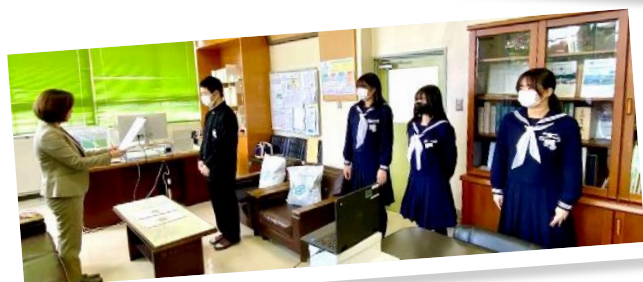
書記、会計、専門委員長、議長・副議長、応援団長は生徒会長が任命しました。生徒会長のスピーチもリモートで行いました。