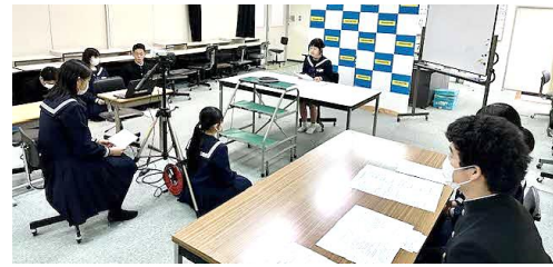
リモートでの生徒総会の様子

校内書初め展開催中！ 今年度は各学級の教室内ではなく、1階と3階廊下にずらりと展示しています