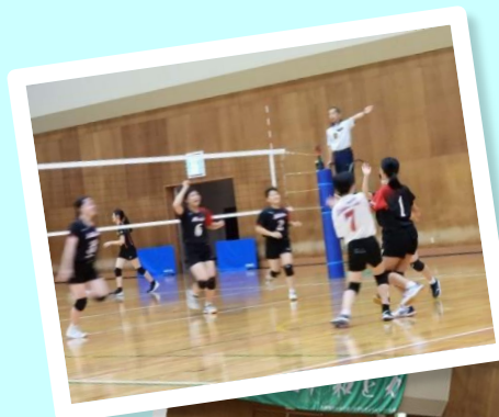
女子バレーボール部