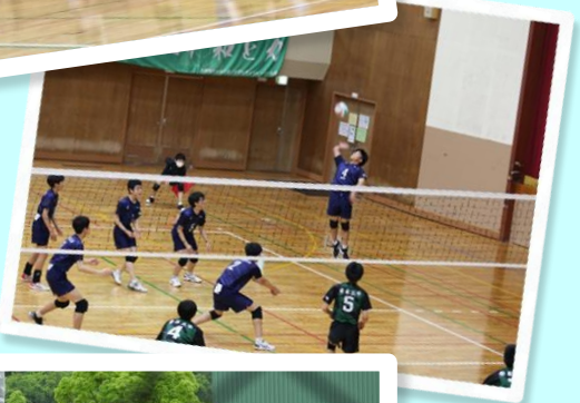
男子バレーボール部