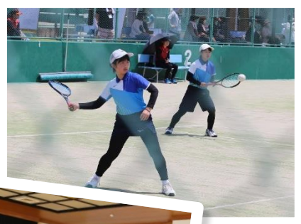
女子ソフトテニス部