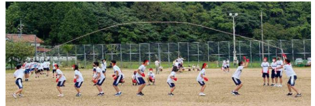
(「みんなでジャンプ」の様子)