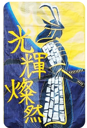
「一人ひとりが輝く」