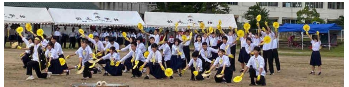
黄組の応援「恋のダイヤル6700」「Lovers」「Eye of the Storm」