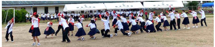
赤組の応援「学園天国」「ピビッとラブ」「HACK」