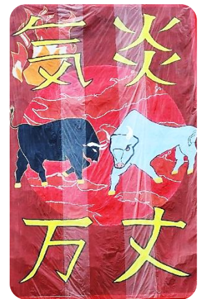
「炎のように熱く燃え上がる」