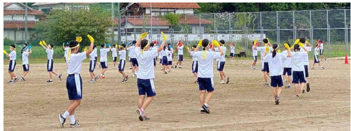
伝統の「伯中音頭」は、円になるところからすでに美しい☆