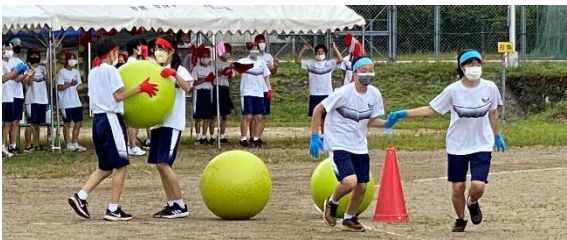
(「愛のパワー」の様子)

(右) 玉入れさせようとしな い人がいる玉入れです (右下) 応援席での応援にも 熱が入っていました (左下) 午前中は雨が降った ので、グラウンド整備を行いな がら実施しました