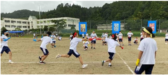
(学年総合リレーの様子)

午前中は雨が降ったりやんだりする中、選手入場・開会式・ラジオ体操・台風の目・障害物競争・1年総合リレー・2年総合リレー・3年総合リレー・愛のパワー・総合リレー・玉入れなんだけど玉入れさせない玉入れ・みんなでジャンプ を行いました。