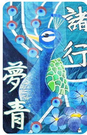
「夢に向かってとどまることなくつき進む」

競技や応援を一生懸命行う姿はもちろんのこと、集合場所に向かうときや競技が終わって役員の仕事に向かうときにきびきびと走って移動する姿、各色のテントでまとまって競技者を応援する姿、体育祭が終わった後、全校が一丸となって互いの活躍をねぎらう姿、疲れを見せずにきばきと後片付けを行う姿は大変立派でした。保護者の皆様、学校関係者評価委員の皆様には、雨の中最後まで観ていただきました。ありがとうございました。