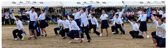
青組の応援「ラムのラブソング」「ペコリナイト」「ロマンチズム」 「Look At Me Now」