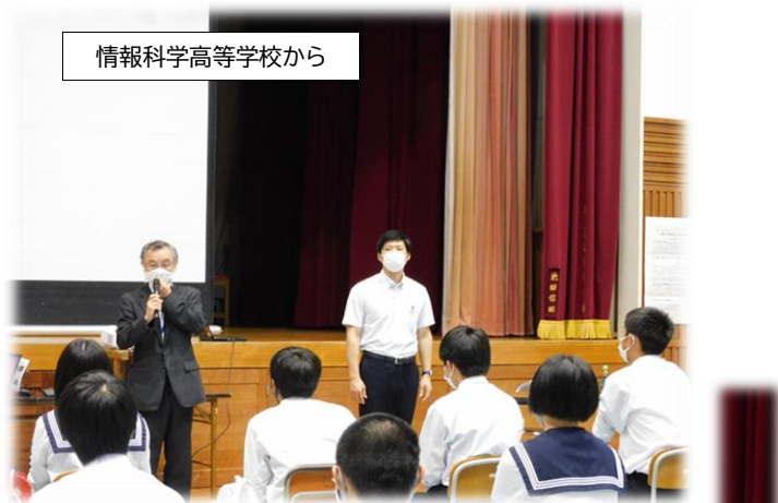
情報科学高等学校から

感染症防止対策のため、お越しいただいたのは、市内の安来高等学校と情報科学高等学校、松江と米子の国立工業高等専門学校との4校でした。ありがとうございました。4校以外の学校は、いただいたDVDの視聴による紹介でしたが、とても工夫された内容で、生徒たちは進路先の情報について理解を深めました。