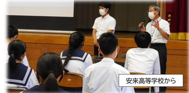
安来高等学校から