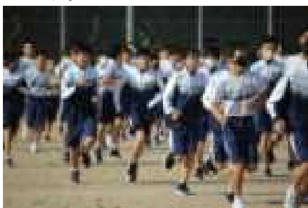
【男子ウォーミングアップの様子】

10月15日、絶好の秋晴れのもと校内ロードレース大会を行いました。学校を出発して卯月方面に向かい、途中で折り返す男子4、6km、女子3、2kmのコースです。