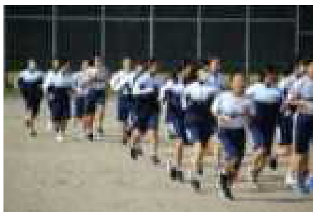
【女子ウォーミングアップの様子】