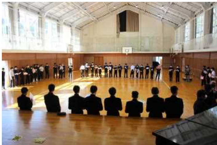
【男子パートは体育館で】

新型コロナウイルス感染拡大防止のため今年度の音楽祭は会場をアルテピアとしています。内容も、合唱コンクールと吹奏楽部の演奏のみとしました。それだけに、合唱にかける意気込みが伝わってくる練習となっています。