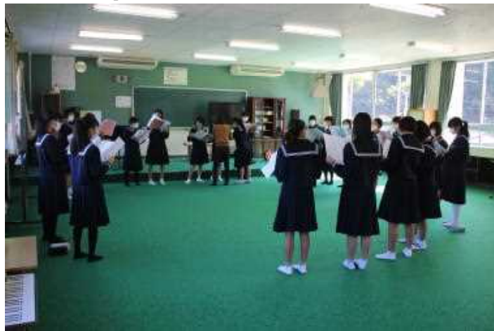
【ソプラノは音楽室で】

今学校では、教室に大型提示装置ビッグパッドや書画カメラの設置、また、今年度中には生徒一人一台のPCクロムブックが配備される予定です。また、来年度からは中学校でも新学習指導要領が全面実施となり、各教科や道徳、特別活動、総合的な学習の時間で「知識・技能」「思考力・判断力・表現力等」「学びに向かう力、人間性等」の資質・能力を育成し、これからの社会を切り拓く「生きる力」を育てていきます。そのための授業づくりとして、ICTを効果的に活用した授業づくりに取り組んでいます。10月19日には島根県教育センターより講師をお招きし、研修を深めました。