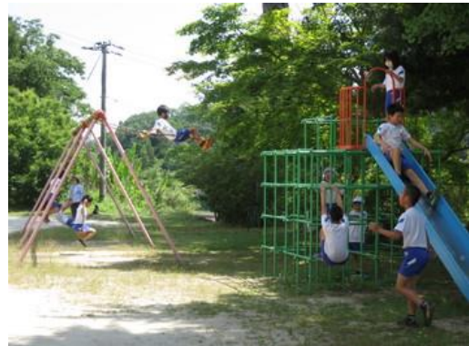
休憩時間は、仲良く楽しく遊んでいます。

※休憩時間になると、子どもたちが元気に外へ遊びに出ます。子どもたちには、車に気をつけるよう指導をしております。保護者や地域の皆様もお車で学校にお越しの際は、校地内の徐行にご協力ください。