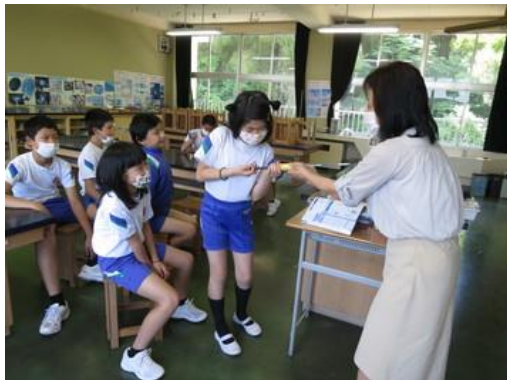
ガス検知管を使って理科の学習（5，6年生）