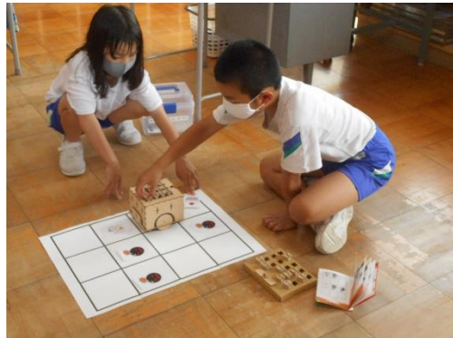
プログラミング学習もしています（全学年）