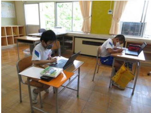
Chromebook を使って社会の勉強（3，4年生）