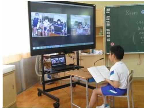
Zoom というテレビ会議システムを使って、比田小学校や山佐小学校と交流しました（5，6年生）